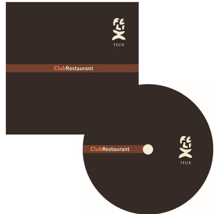
8-Seiten-Broschüre für den Versand an Evtbtagenturen mit integrierter CD / Imagefilm